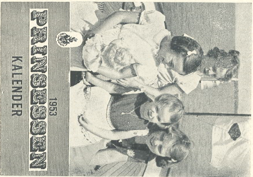
PRINSENBOORN 1953 KALENDER

Zoals voorgaande jaren geeft ook dit jaar „Pro Juventute“ de bekende Penningkalender uit. Ook dit jaar werd deze kalender samengesteld uit dertien exclusieve foto's, welke H.M. Koningin Juliana speciaal voor dit doel ter beschikking stelde. De foto's, welke door Z.K.H. Prins Bernhard en enkele zijner vrienden werden genomen, munten uit door hun ongedwongenheid en charme. De goede papierkwaliteit en zorgvuldige druk geven een prachtige reproductie der foto's en maken deze kalender, welke verder typografisch uitstekend verzorgd is, tot een begerenswaardig bezit.